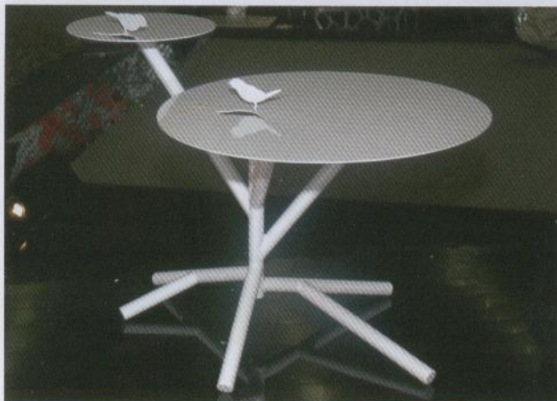
Tisch mit ausgeschnittener Vogelform