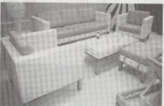
スカイライン・ジャヤ社