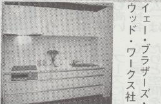
イエー・ブラザーズ・ウッド・ワークス社