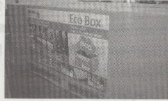
エコボックス (ブレマ社)

ブレマ社はドイツの家具メーカー。今回はベトナム支社から出展した。同社は環境に配慮する意識が高く、ひとつのテーブルセットをひとつの