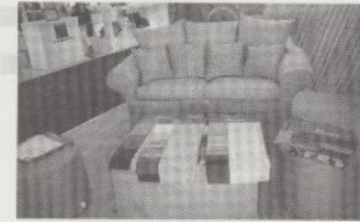
ファブリックソファ (サンブレラ社)

サンブレラ社はアメリカのファブリックメーカー。家庭やコントラクト家具、ボートのインドアやアウトドア家具、オーニングなどを展開している。